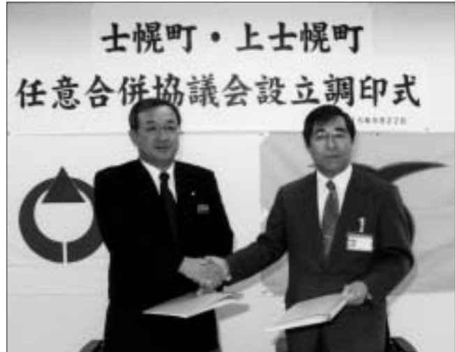
9月22日に開催された任意合併協議会設立調印式(上)と第1回協議会(下)