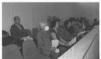
上士幌町議会の傍聴