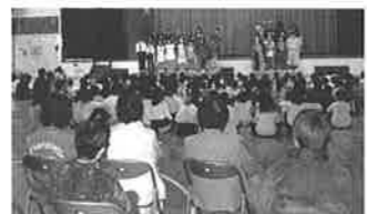
学習発表会の総練習を参観