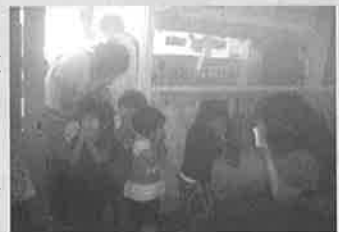
▲訓練用の煙を用いた避難訓練 (上士幌保育所)

もし今後、避難訓練に参加する機会があった時は、思い出してください。その訓練での経験と記憶が、いざというときあなたの命を守るということを。真剣にやることは大切な事です。