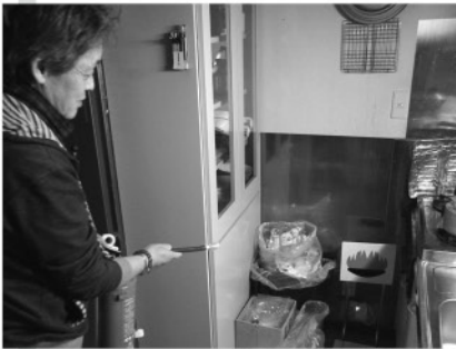
スナック話の訓練風景