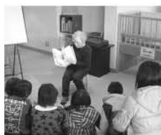
会場は図書館「お話し会」です。

◆内容 図書館職員による絵本の読み聞かせです。 ※えほんのトピラは小学生以上を対象としています。