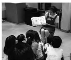
会場は図書館「お話のへや」です。