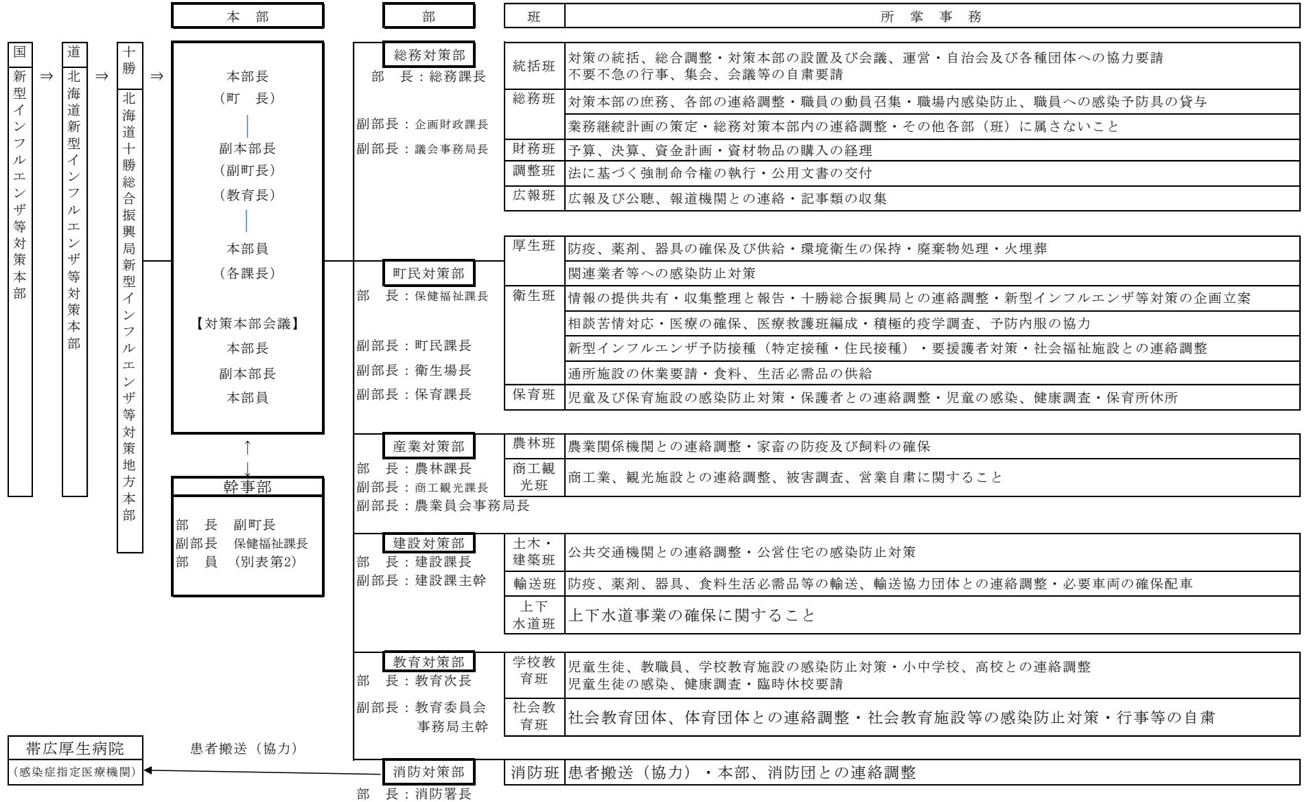
別表第3(第3条・第6条関係) 上士幌町新型コロナウイルス等対策本部の組織及び所掌事項(上士幌町地域防災計画に準じる)