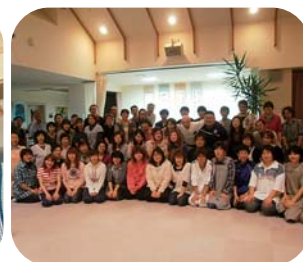
▲【特別養護老人ホーム「上士幌すずらん荘」】