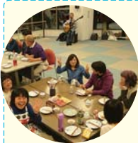
▲【移住者交流会の様子】

移住・二地域居住者54組103名(平成17～26年度実績)の成果があります。毎月、移住者の交流会があり、楽しく食事をしながら、情報交換や仲間づくりができます。