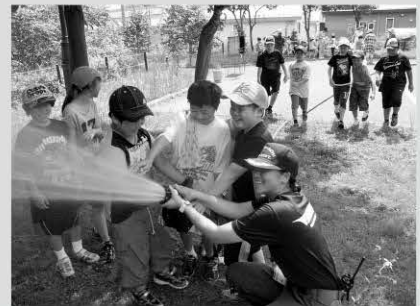
▲学童保育所での放水体験