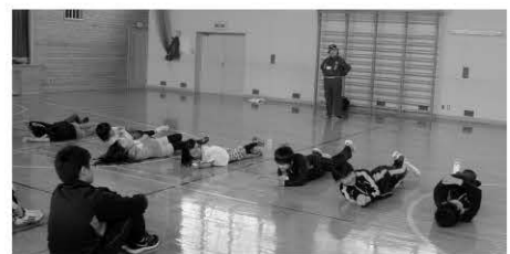
▲衣服に火が付いたときの訓練

本校は、開校以来、地域に根ざした学校として取り組んでまいりました。防災教育についても、安全教育の一環としてさまざまな取り組みを学校内だけでなく、地域と連携して実施しています。これらの取り組みにより、子どもたちは「自らの命は自らで守る」ために、自分自身で考えて行動できる力を育てています。避難訓練では、校内だけでなく、さまざまな場所を想定した訓練も取り入れています。今年度をもって本校は90年の歴史に幕を下ろすこととなりますが、本校最後の子どもたちを安心して送り出すことができるよう防火管理に取り組んでまいります。