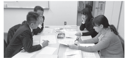
共通ツール開発の様子

この結果を受けて、子どもたちの成長に応じた「自己管理能力」を身に付けさせるための教材を開発することとし、議論を重ねてきました。そして、「生活習慣」「時間の管理」「計画の実行」「経験の活用」を身に付けるためのツールとして、認定こども園ではシール帳を、小学校ではメモ帳(高学年では時間の管理を含む)及び家庭学習帳を、中学校ではスケジュール帳に心と身体の記録を加えたものを、高校では市販の高校生用の手帳を活用することとし、現在各学校において運用方法等について検討をしています。