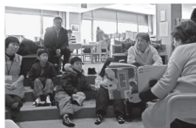
会場は図書館「お話しのお話のへや」です。