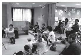
会場は図書館「お話し会」です。