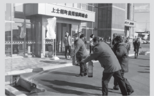
◀ J Aでの避難訓練

J A事務所・資材店舗、Aコーブルピナ、上土幌福寿協会、糠平小学校、スポーツセンター、上土幌高校、生きがいセンターゲートボール場