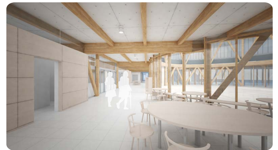
■プロムナードイメージ: 憩いスペースからエントランスホールをみる