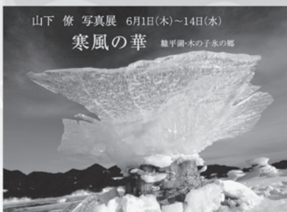
山下 僚 写真展 6月1日(木)～14日(水) 寒風の華 糠平湖・木の子氷の郷