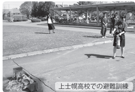
上士幌高校での避難訓練