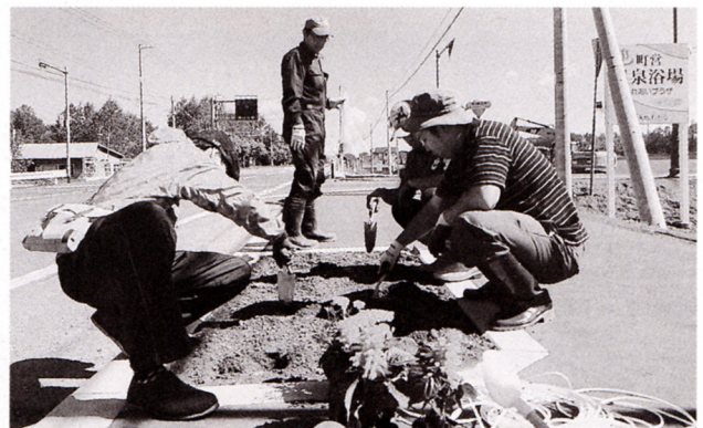
国道沿い花壇整備の様子