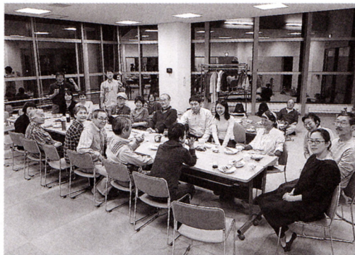
5月28日「誕生会」時の全体写真