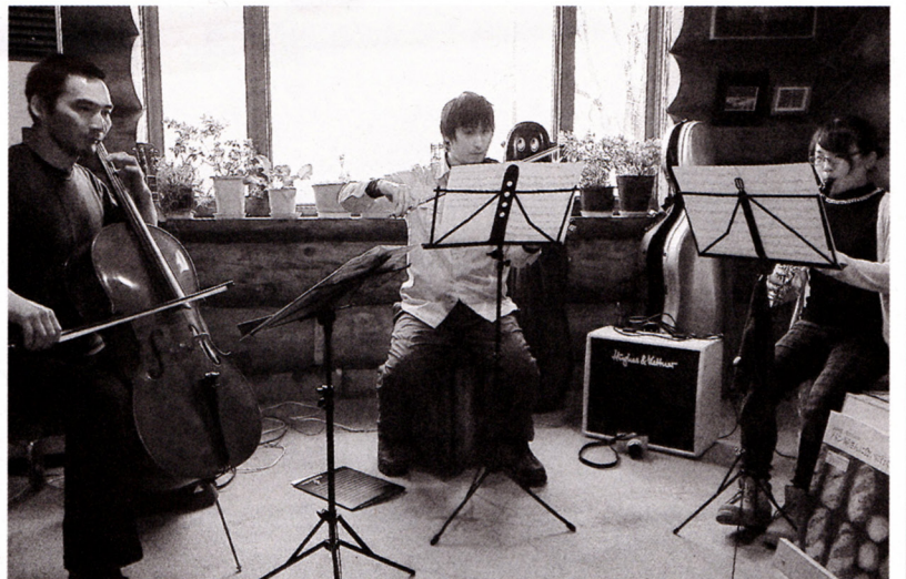
三股山荘での演奏会時の様子

現在の団員は最大でも十一人と少ない状態で、団員を絶賛募集中です。参加希望の方は一度お問い合わせください。合わせいただくか、直接見学にいらしてください。初心者でも大歓迎です。子どもでも参加可能ですが、時間が遅いので、その場合は保護者同伴でお願いします。