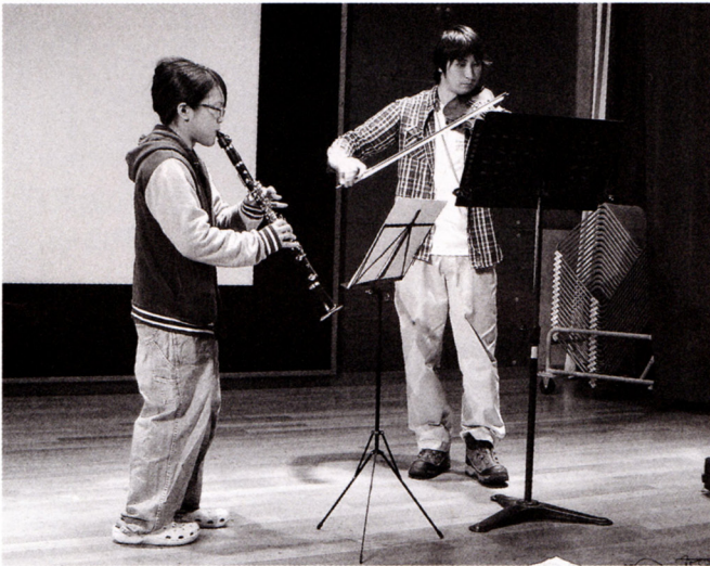
生涯学習センターでの練習風景

股山荘にて演奏会を実施させていただくことができました。これからも、様々な演奏の機会を作っていきたいと思っております。また、演奏させていただける場