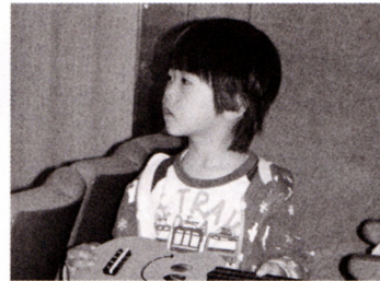
団員の子ども達も積極的に参加!

サークルを立ち上げたきっかけは単純に、上士幌でも趣味のヴァイオリンを楽しみたいという思いでした。私は、もともと根室市で交響楽団に所属していましたが、根室市を離れてからは音楽に触れる機会がめっきり減ってしまいました。上士幌でもヴァイオリンを楽しみたい!でも、自分の知り限り上士幌でヴァイオリンを楽しむことができる団体がない。じゃあ自分で作っちゃえ!というのが立ち上げまでの経緯です。現在は、ヴァイオリンやチェロ、クラリネットなどのクラシック系からギターやベースなどのバンド系まで様々な楽器が集まりつつやかめつつやかな楽団ですが、先日、おかげ様で曲がりなりにも一