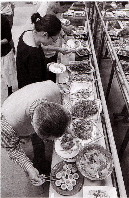
上土幌でとれた食材等様々な料理が並ぶ