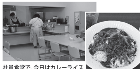
社員食堂で、今日はカレーライス

現在、サンクローバーさんでは「調理員」1名を募集しています。気になる方は、ぜひ無料職業紹介所までお問い合わせください！