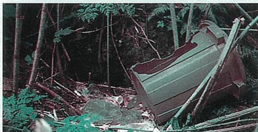
ヒグマに荒らされたゴミバケツ

実際に2001～2005年度に全道で銃器によって捕獲されたヒグマ619個体の胃袋を分析した結果、3.7%に当たる23個体からゴミ類が出現しました。