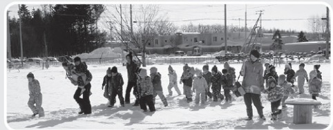
認定こども園での避難訓練