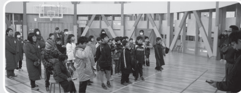
学童保育所での避難訓練