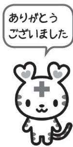
日本赤十字社 マスコットキャラクター 「ハートちゃん」

皆さまからいただいたこの社資は、日本赤十字社本部へ送金され、発展途上国への援助や献血事業、救護要員の育成、援助物資の整備、震災復興など、赤十字社活動に有効活用されています。