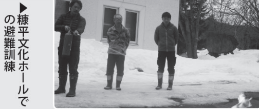
▶糠平文化ホールでの避難訓練