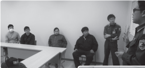
▲上士幌農業協同組合での避難訓練