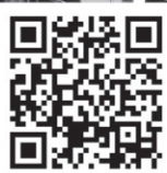
▲クラウドファンディングホームページQRコード