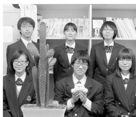
△今年度の部員です。よろしく。1年生の入局待ってまーす。

これまで本校新聞局が担当してきた「月刊上高」ですが、学校で編集発行してきた「上高たより」と一体化した欄として掲載していくこととなりました。とはいえページのおおよそ下段を担当し、本校新聞局の生徒が執筆した記事と写真を載せていくことになりました。