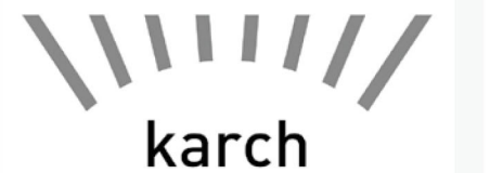
▲株式会社カーチ(ロゴ)

各団体と連携しながら、町民の方々と一緒になってその魅力を最大限に活かしていきたいと思えます。お客様が「上士幌町に来ていただく仕組み」「お金を落としていただく仕組み」「地域の関係者が参加して嬉しい仕組み」「地域の課題を解決する」をモットーに上士幌町のファンを増やすためにチャレンジしていきたいと思えます。