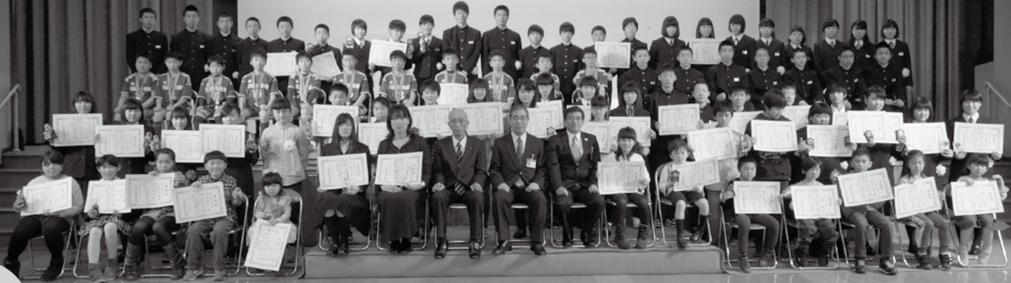
平成29年度 上士幌町文化賞・スポーツ賞等表彰式

3月18日(日)、山村開発センターにおいて『平成29年度上士幌町文化賞・スポーツ賞等表彰式』が行われ、本町の文化の向上やスポーツの振興に功績のあった7団体、43個人が各賞を受賞されました。