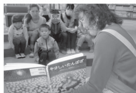
会場は図書館「お話し会」です。