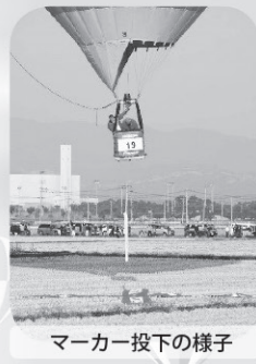
マーカー投下の様子