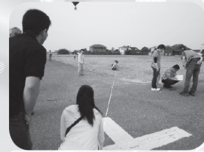
マーカー計測の様子