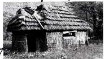
現在の上土農にある干せ