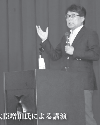
「人口減少社会における地方の役割と戦略」と題した、元総務大臣増田氏による講演