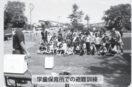
学童保育所での避難訓練