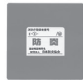
敷物用ビースラベル