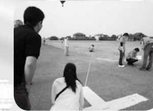
マーカー計測の様子