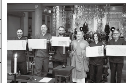
△写経等体験プログラム検証