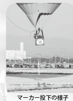
マーカー投下の様子

「オブザーバー」とは、熱気球競技において各競技の記録を行う記録員のことです。 競技参加チームに同行して、一番間近で気球を眺めることができます! 【オブザーバーの主な役割】 飛行に関わる「位置、時間、距離」を記録します。