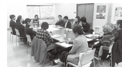
△昨年度のアイデア出しの様子

上士幌町の食材を活用した『食事メニュー』、お土産物などの『加工品』、滞在向け旅行商品の『体験プログラム』など、いままで上士幌町になかった新しいモノ・コトを商品化するプロジェクトメンバーを今年度も募集致します。みんなで話し合いながら一緒に新商品を創りませんか。 どなたでもご参加頂けますのでお気軽にご相談下さい。