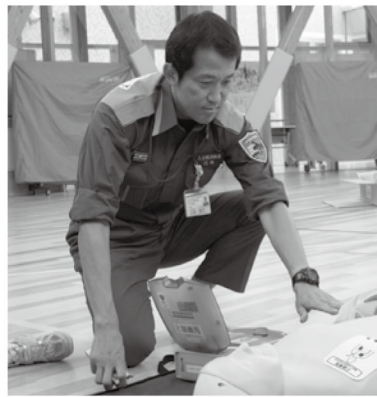
※お問い合わせは、上士幌消防署(☎2-2519)まで