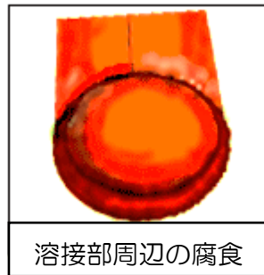
溶接部周辺の腐食