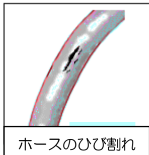
ホースのひび割れ