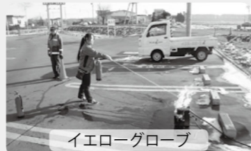
イエローグローブ

※防火管理者が選任されている施設は避難訓練が必要です。実施する際は消防署にお知らせください。