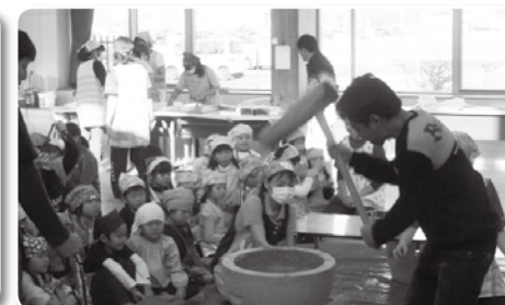
▲子どもたちから大きな掛け声!