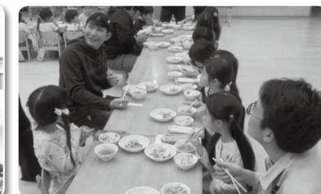
▲異文化交流は園児たちにとって「ふつうの出来事」みたいです