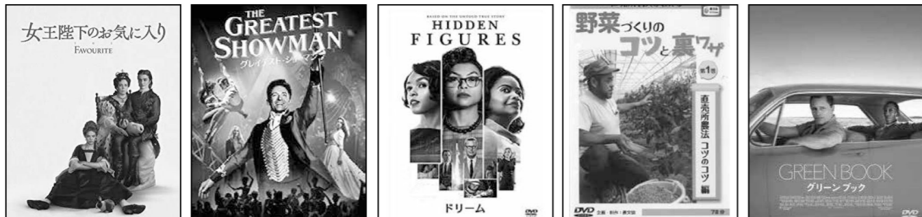
女王陛下のお気に入り グレイテスト・ショーマン ドリーム 野菜づくりのコツと裏ワザ グリーン・ブック

※新作DVDはおひとりさま1タイトルの貸出しとなります。皆様にお楽しみいただけますと幸いです。