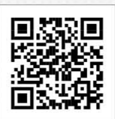
▲商工会ホームページQRコード

町民の皆さまにとっても「なるほど!」となる情報があるかもしれません。また、お得な情報も随時掲載します。