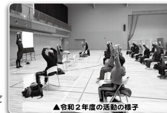
▲令和2年度の活動の様子

※お申し込みやお問い合わせは、教育委員会生涯学習課生涯学習・社会教育担当(☎2-3024)まで