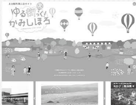
▲「ゆる街っく!かみしほろ」

案内看板と同様に、商店街への来訪を促すため飲食店を中心としたマップを作成しました。コンパクトなサイズですので、気軽に持ち歩いて商店街を散策してください。飲食店のおいしそうなお料理写真もたくさん掲載されていますので、ぜひご覧ください!