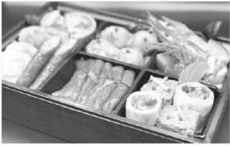
※仕入れの都合により内容が変更となる場合があります。

十勝ハープ牛ローストビーフなど厳選した10種類を詰め合わせた豪華オードブルです。