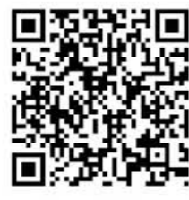
▲住宅用火災警報器アンケートフォーム

消防団の行事・訓練などでサイレンを吹鳴する場合がございますが、その際はあらかじめ周知させていただきます。