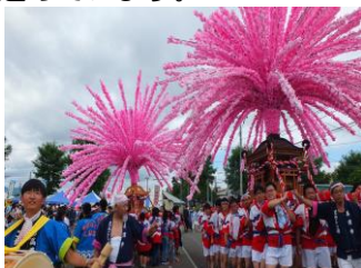
しほろ7,000人のまつり

豆類、てん菜、スイートコーンなどの農産物が生産されています。また、肉用牛、乳用牛の飼育なども盛んです。士幌町では、今も未来も輝き続ける「しほろ」を目標とした「輝く未来へ しほろ創生」をテーマに町づくりを進めています。