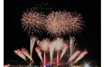
きらめきタウンフェスティバル