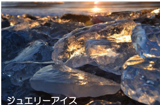
ジュエリーアイス

「トエコロ」(大きなフキが生えていたところ)や「トイ・コロ」(土多く礫少ないところ)等のアイヌ語が語源とされています。