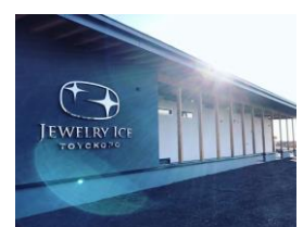
ジュエリーハウス