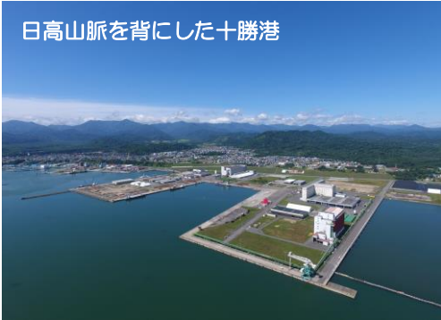
日高山脈を背にした十勝港

アイヌ語の「ピルイ」が語源といわれ、「ピ」は「石が転がる」、「ルイ」は「砥石がとれる地」という意味。