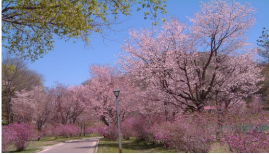
義経の里本別公園

アイヌ語の『ボン・ベツ（小さい川）』を語源とし、本別市街地で利別川と合流する本別川から名付けられました。道の駅「ステラ★ほんべつ」では、本別町のゆるキャラ「元気くん」が入り口で多くの観光客を出迎え、町内特産品の販売や、観光情報を発信しています。また、道東自動車道のインターチェンジや、釧路方面と北見方面への分岐点もあり、道東圏と道央圏を結ぶ交通の要衝となっています。