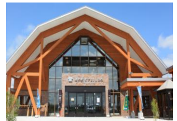
道の駅ピア21しほろ