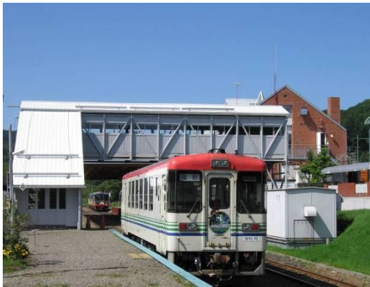
ふるさと銀河線りくべつ鉄道

アイヌ語で「鹿のいる川」または「危ない高い川」という意味の「リクンベツ」に由来しているといわれている。