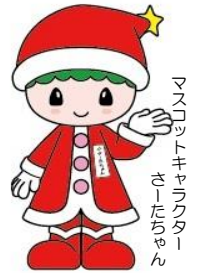
マスコットキャラクター さーたちちゃん