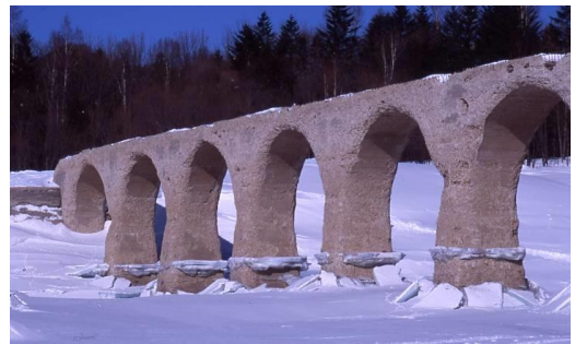
タウシュベツ川橋梁(冬)

また、移住定住・二地域居住・農林商工連携を推進し、ふるさと納税をはじめとした「都市と農村の交流と対流」のまちづくりのほか、基幹産業である酪農・畜産業の特性を活かし、バイオマス資源によるエネルギーの地産地消にも取り組んでいます。