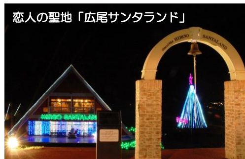
恋人の聖地「広尾サンタランド」