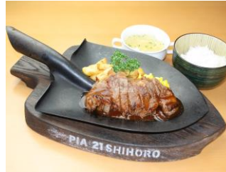
しほろ牛剣先ステーキ