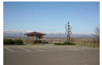
美蔓パノラマパーク