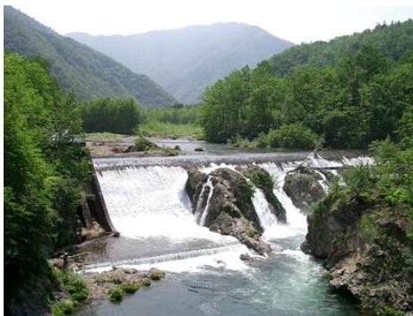
ピョウタンの滝(札内川園地)

札内川の語源であるアイヌ語で「乾いた川」を意味する「サチナイ」と、その中流に位置するという意味。