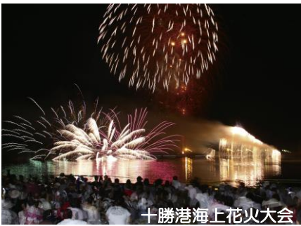
十勝港海上花火大会