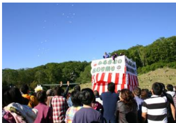
ふるさとのみり祭り

アイヌ語の「オーラポロ」が転訛して浦幌となり、「オー」は川尻、「ラ」は草の葉、「ポロ」は大きいで「川尻に大きな葉が生育するところ」といわれている。