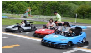
交通公園ゴーカート