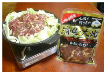
ギョウジャンニンク入りジンギスカン

十勝管内の最東端に位置し、町土の約74.2%を森林が占める雄大な自然と、海産資源豊富な太平洋に面した町です。