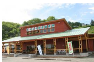
とよころ物産直売所