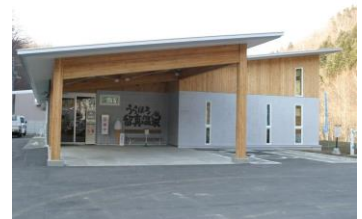
うらほろ留真温泉