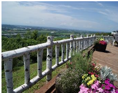
十勝が丘展望台シーニックカフェ (7月上旬～9月下旬)