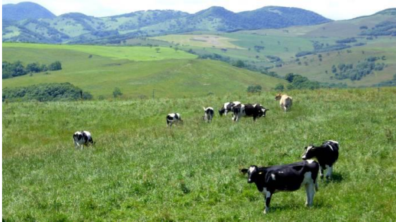
ナイタイ高原牧場

昭和6年士幌村より分村し、士幌村の川上に位置していたため、「上士幌村」となった。