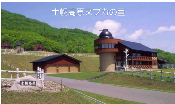
士幌高原ヌブカの里

“広大な土地”を意味するアイヌ語の「シュウウォロー」が訛って変化して名付けられたといわれている。