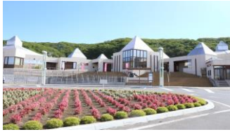
道の駅「ステラ★ほんべつ」