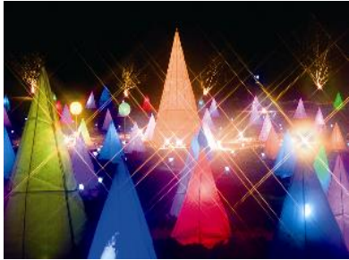
十勝川白鳥まつり 彩凜華 (1月下旬～2月下旬)

アイヌ語の「オトプケ」（毛髪が生ずるという意）から転訛したもので、音更川、然別川など河川がたくさん流れているところから付けられたと言われている。