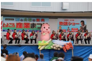
とよころ産業まつり

十勝川の最下流に位置する十勝発祥のまちです。町のシンボルとなっている樹齢150年の「はるにれ」は2本の木が一体化した美しい姿が人気で多くの観光客が訪れます。また、秋には「産業まつり」が開催され、海と大地の実りを大いに堪能できます。近年は大津海岸の「ジュエリーアイス」が注目を集めています。