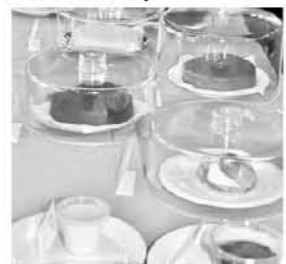
▲手作りおやつカフェ