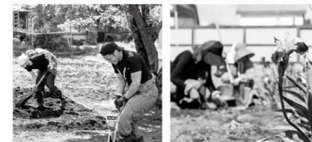
▲ハレタガーデンの活動風景

上士幌ホロロジでは町民の皆さまへ町やまちづくり会社の情報を発信しています！ 「こんなことをやっているよ」という情報を【新たにわかりやすく発信】しているのでぜひご覧ください！