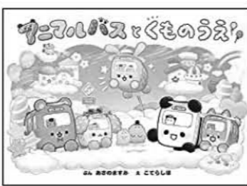
アニマルバスとくものうえ してら しほ/え