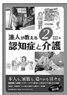
達人が教える2認知症と介護 北海道新聞社/編