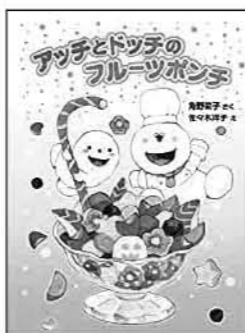
アッチとドッチのフルーツポンチ 角野 栄子/さく