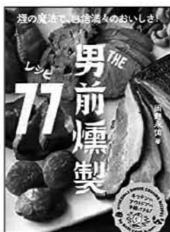
THE男前煉製レシビ77 岡野 永佑/監修