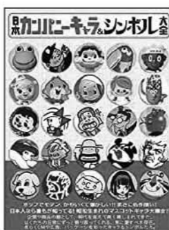
日本カンパニーキャラ&シンボル大全 辰巳出版/出版