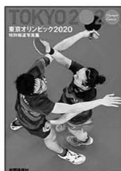
東京オリンピック2020 共同通信社/出版