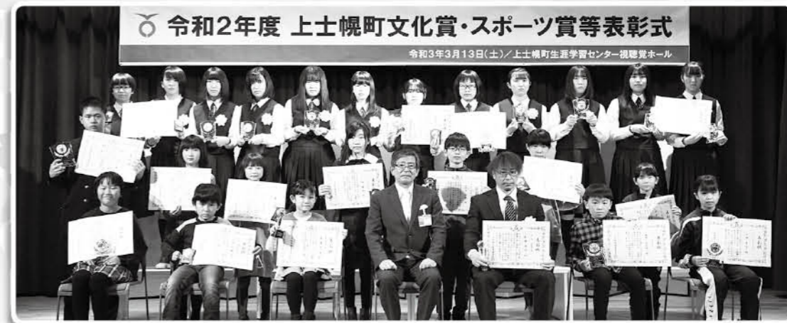
令和2年度 上士幌町文化賞・スポーツ賞等表彰式