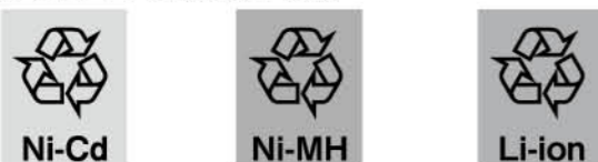
▲ニカド電池 ▲ニッケル水素電池 ▲リチウムイオン電池