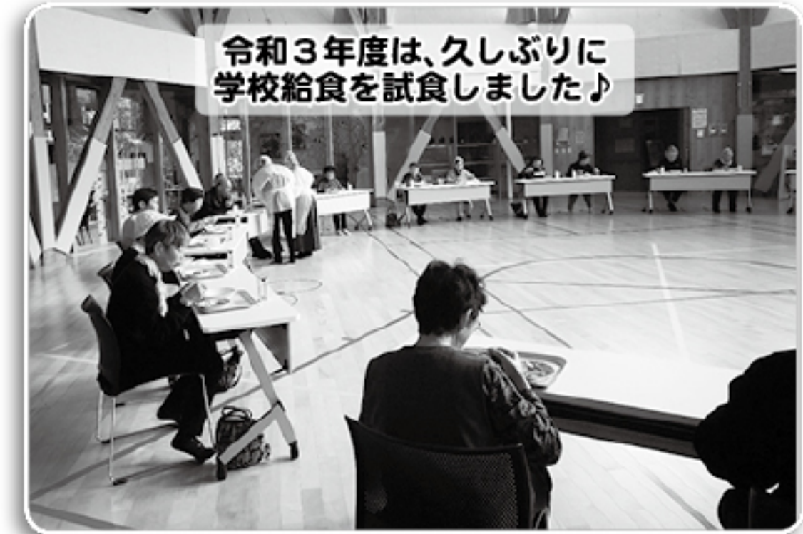
令和3年度は、久しぶりに学校給食を試食しました!

※お申し込みやお問い合わせは、教育委員会生涯学習課生涯学習・社会教育担当(☎2-3024)まで