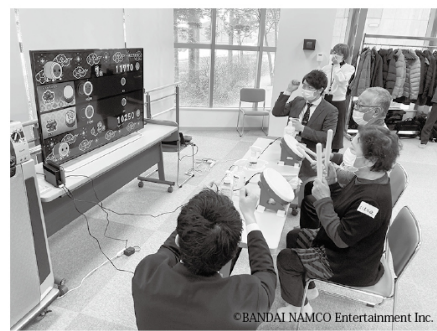
▲リズムに合わせてバチで太鼓を叩きます♪ 皆さんとてもお上手でした!

eスポーツ(注)を活用した、介護予防の新しい取り組みを始めるため、3月15日(火)にふれあいプラザで6名の方にお集まりいただき、音楽に合わせて太鼓をたたくゲームに挑戦していただきました! 参加者の募集や開催時期については、広報かみしほろ6月号においてお知らせいたします。 (注) e(イー)スポーツとは、パソコンやテレビゲームをスポーツ競技として捉え、皆で楽しんで行うものです。 頭も体も使って楽しめるため、高齢者の介護予防にも効果的であるとして、注目されています。 ※お問い合わせは、地域包括支援センター(☎2-5555)まで