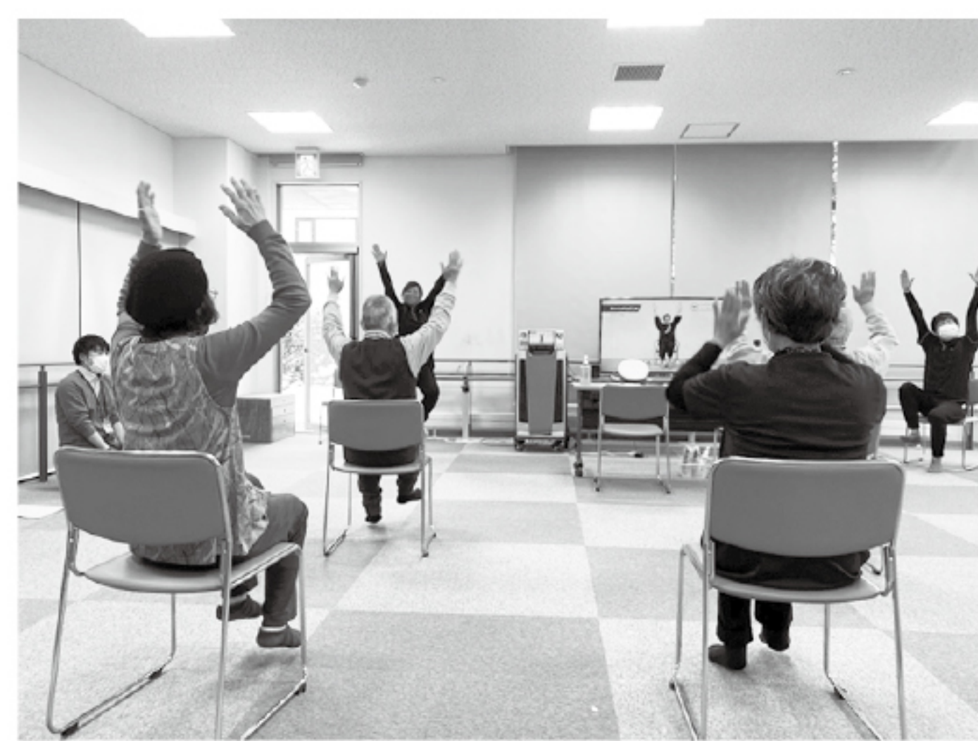
▲ゲームの前に音楽健康指導士の方と一緒に歌と音楽に合わせて準備体操をし、心と体をほぐします。