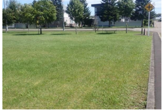
⑩みどり団地緑地・道路用地