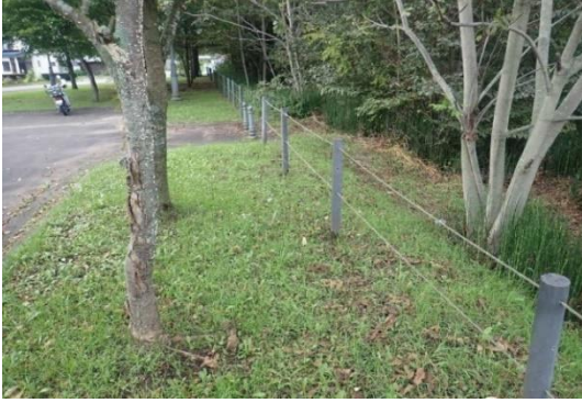
⑨11 区ポケットパーク