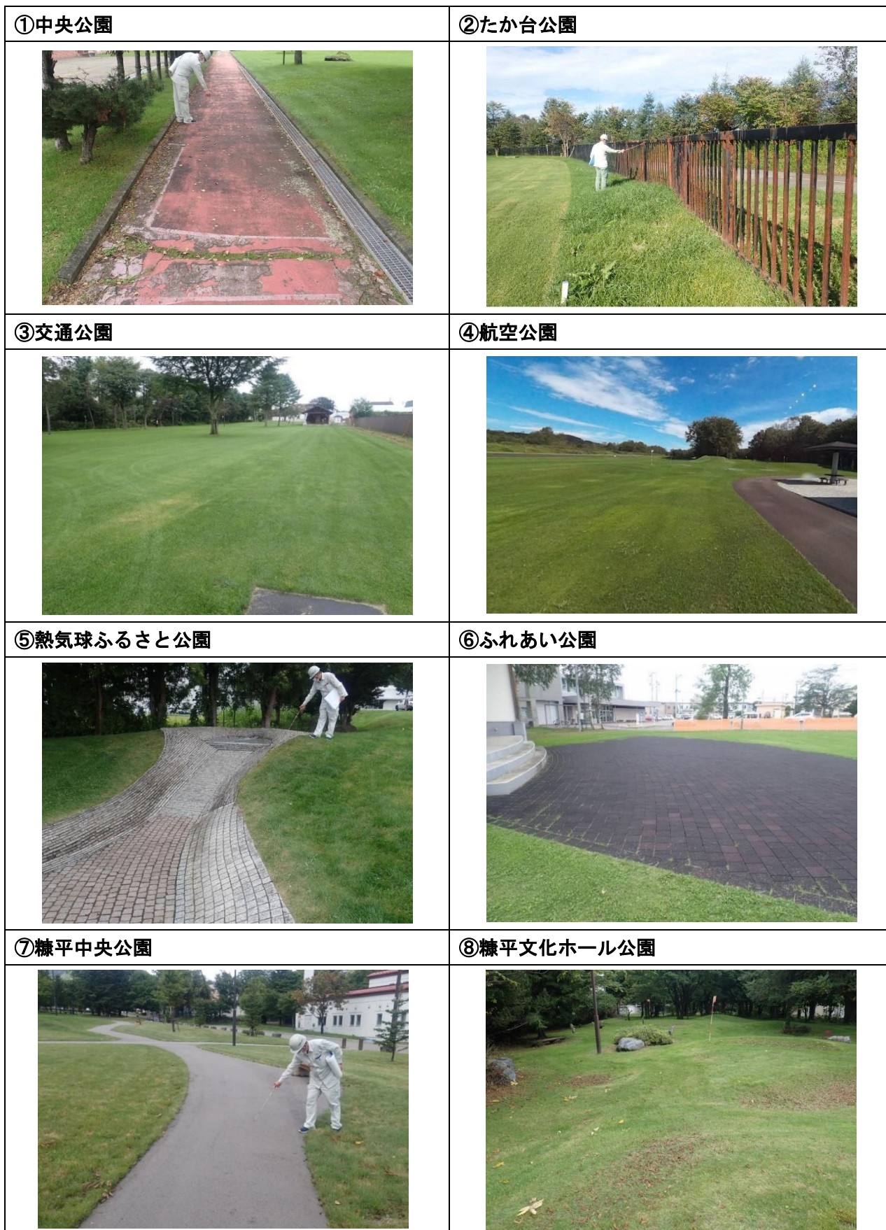
図 2-2 隣接公園・地区公園調査の様子