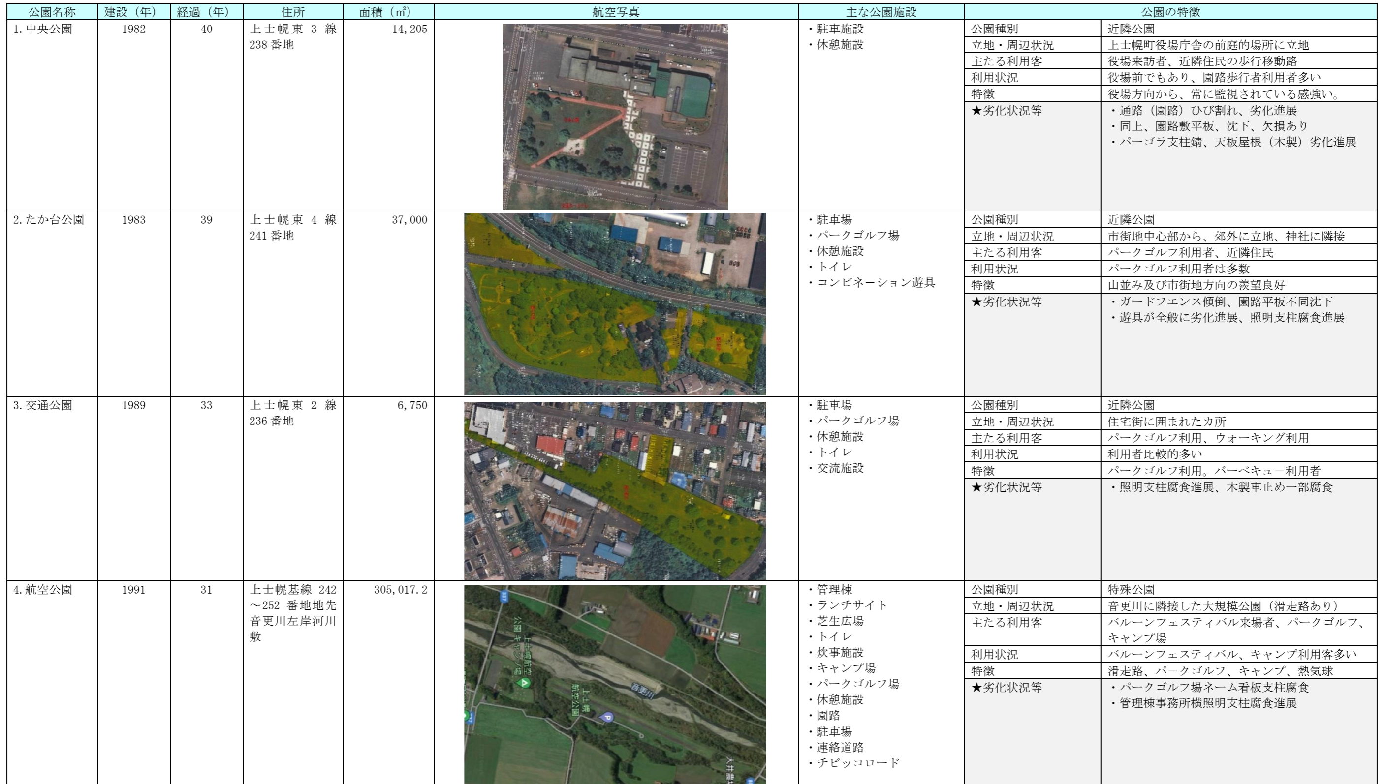
表 2-3 隣接公園・地区公園総括表