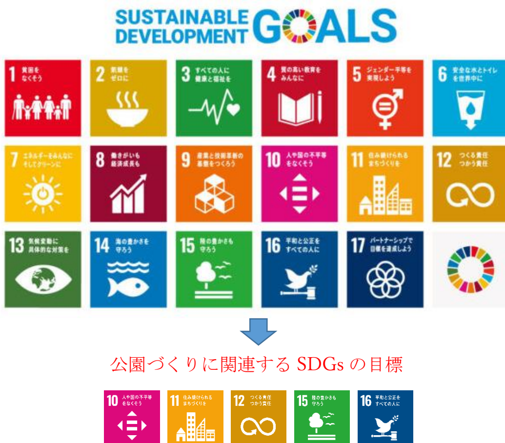
図 1-1 公園づくりに関連する SDGs の目標

公園・緑地においても、地域における貴重な緑のスペースとして、地球温暖化防止に加えて、環境保全、景観形成、防災、子育て、健康・レクリエーション、賑わいなど様々な効果をもち、持続可能なまちづくりに欠くことのできない基盤施設であることから、SDGs と脱炭素化に配慮した整備・維持管理が必要となります。