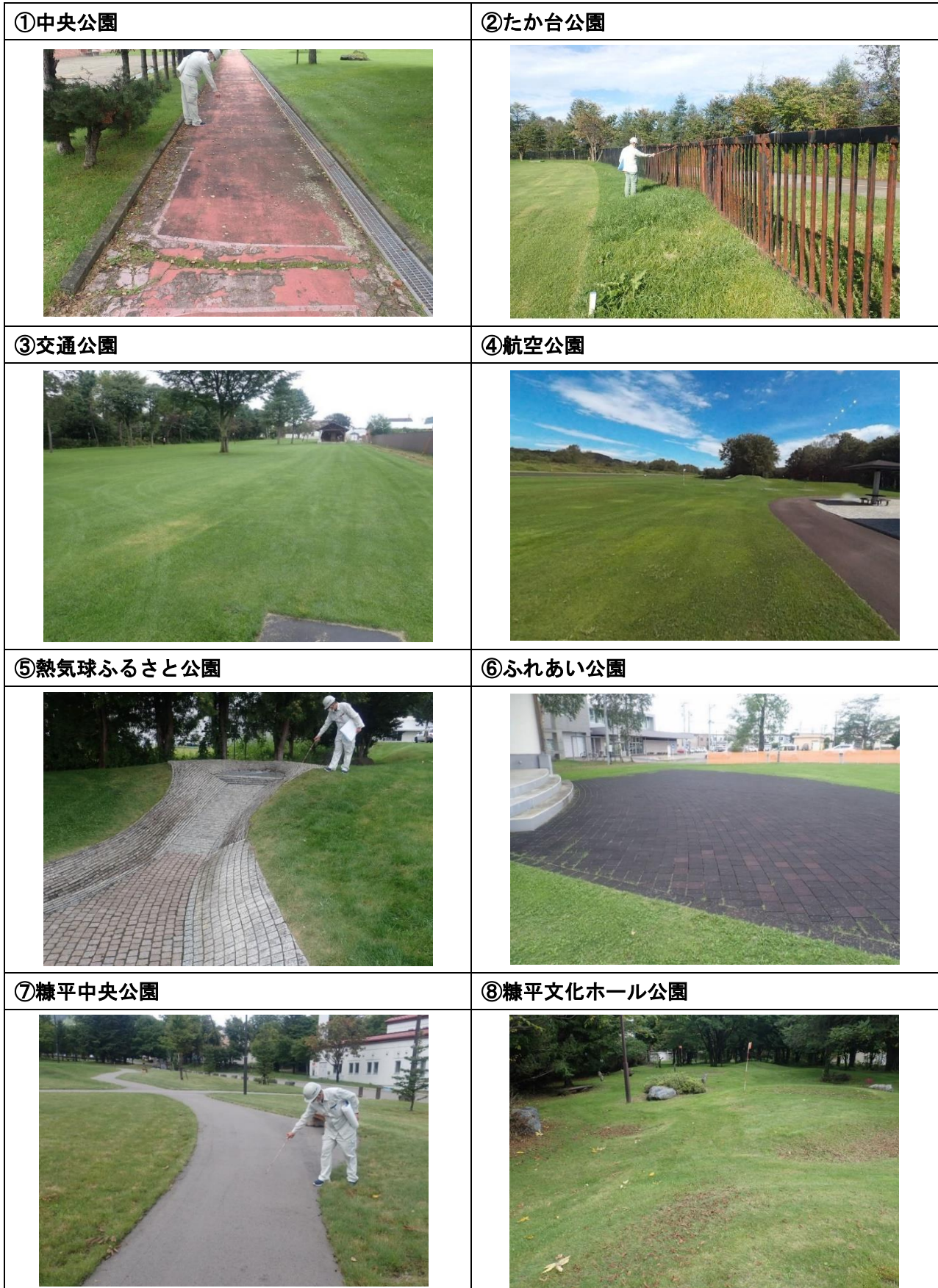
図 2-2 隣接公園・地区公園調査の様子