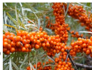
奇跡の果実 シーベリー

清澄な水と空気、そして肥沃な大地。士幌町は自然の恵みに培われた実り豊かな純農村地帯で、じゃがいも、小麦、豆類、てん菜、スイートコーンなどの農産物が生産されています。また、肉用牛、乳用牛の飼育なども盛んです。士幌町では、今も未来も輝き続ける「しほろ」を目標とした「輝く未来へ しほろ創生」をテーマに町づくりを進めています。