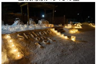
Shihoro on ICE