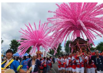
しほろ7000人のまつり