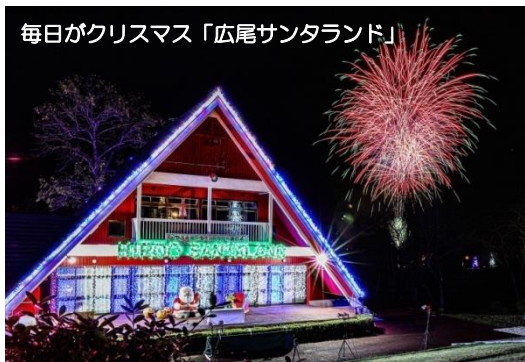
毎日がクリスマス「広尾サンタランド」

アイヌ語の「ピルイ」が語源といわれ、「ピ」は「石が転がる」、「ルイ」は「砥石がとれる地」という意味。