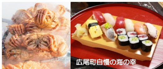
広尾町自慢の海の幸