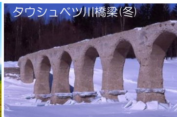
タウシュベツ川橋梁(冬)