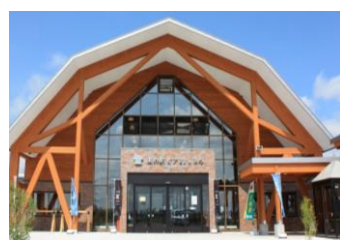
道の駅ピア21しほろ