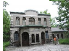
六花亭アートヴィレッジ 中札内美術村

日高山脈中央部を源とする清流・札内川流域に広がる「日本で最も美しい村」です。その清流を集め豪快に流れ落ちる「ピョウタンの滝」がある札内川園地は、滝周辺の豊富なマイナスイオンを浴びながら自然豊かな園内を散策できる癒しの空間です。毎年多くの観光客が訪れ、夏はキャンプ場としても賑わいをみせています。