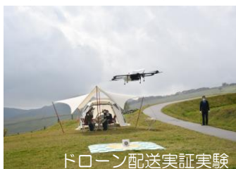
ドローン配送実証実験

また、移住定住・ワーケーション・二地域居住・農林商工連携を推進し、ふるさと納税をはじめとした「都市と農村の交流と対流」のまちづくりのほか、基幹産業である酪農・畜産業の特性を活かし、バイオマス資源によるエネルギーの地産地消にも取り組んでいます。