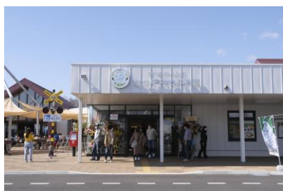
道の駅おとふけ「なつぞらのふる里」 (令和4年4月移転オープン)