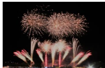
きらめきタウンフェスティバル