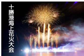
十勝港海上花火大会