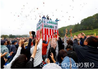
ふるさとのみのり祭り

アイヌ語の「オーラポロ」が転訛して浦幌となり、「オー」は川尻、「ラ」は草の葉、「ポロ」は大きいで「川尻に大きな葉が生育するところ」と言われている。