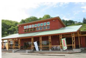
とよころ物産直売所