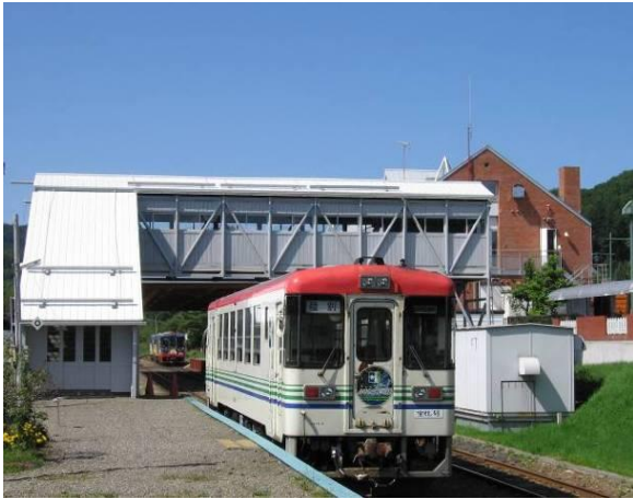
ふるさと銀河線りくべつ鉄道

アイヌ語で「鹿のいる川」または「危ない高い川」という意味の「リクンベツ」に由来しているといわれている。