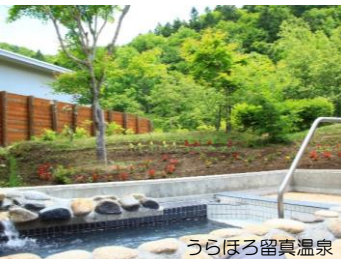
うらほろ留真温泉