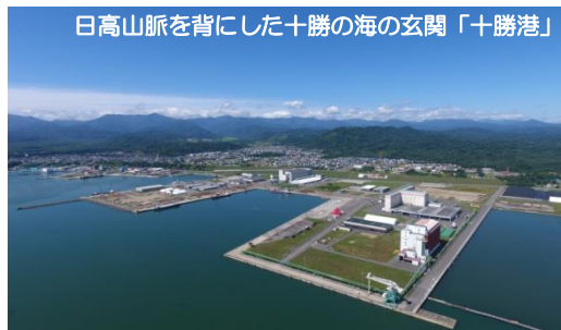
日高山脈を背にした十勝の海の玄関「十勝港」

太平洋や日高山脈などの豊かな自然に囲まれた十勝最南端のまち・広尾町は、2018年に開町150年を迎え十勝で最も歴史が古く、サンタクロースの故郷であるノルウェーから国外初・日本唯一の「サンタランド」に認定されています。