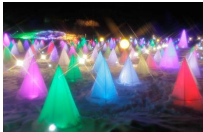
十勝川白鳥まつり 彩凧華 (1月下旬～2月下旬頃)

アイヌ語の「オトプケ」（毛髪が生ずるという意）から転訛したもので、音更川、然別川など河川がたくさん流れているところから付けられたと言われている。