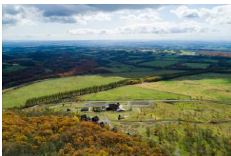
士幌高原ヌブカの里

“広大な土地”を意味するアイヌ語の「シュウウォロー」が訛って変化して名付けられたと言われている。