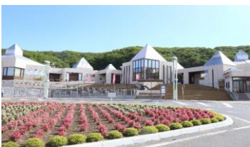
道の駅「ステラ★ほんべつ」