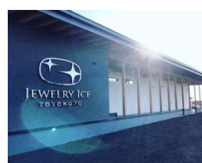
ジュエリーハウス