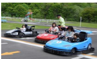
交通公園ゴーカート