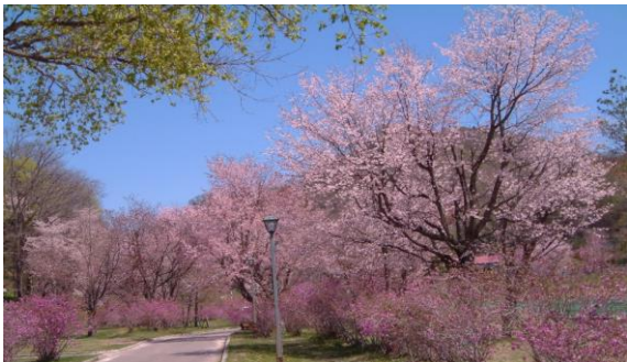
義経の里本別公園

アイヌ語の『ボン・ペツ（小さい川）』を語源とし、本別市街地で利別川と合流する本別川から名付けられました。道の駅「ステラ★ほんべつ」では、本別町のゆるキャラ「元氣くん」が入り口で多くの観光客を出迎え、町内特産品の販売や、観光情報を発信しています。また、道東自動車道のインターチェンジや、釧路方面と北見方面への分岐点もあり、道東圏と道央圏を結び交通の要衝となっています。