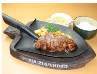
しほろ牛剣先ステーキ