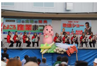
とよころ産業まつり

十勝川の最下流に位置する十勝発祥のまちです。町のシンボルとなっている樹齢150年の「はるにれ」は2本の木が一体化した美しい姿が人気で多くの観光客が訪れます。また、秋には「産業まつり」が開催され、海と大地の実りを大いに堪能できます。近年は大津海岸の「ジュエリーアイス」が注目を集めています。