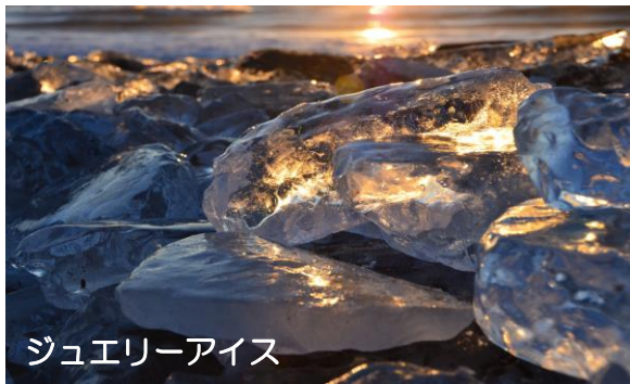
ジュエリーアイス

「トエコロ」(大きなフキが生えていたところ)や「トイ・コロ」(土多く礫少ないところ)等のアイヌ語が語源とされています。