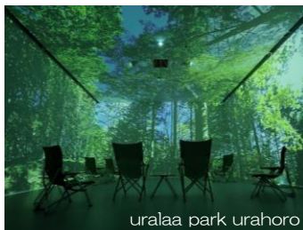
uralaa park urahoro